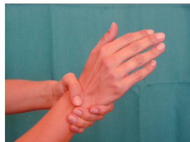
7. Abschließend Handgelenke desinfizieren