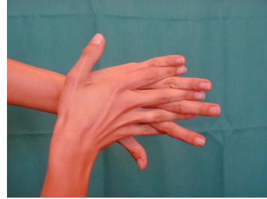
2. Mit rechten Handinnenfläche linken Handrücken und mit linken Handinnenfläche rechten Handrücken desinfizieren, dabei Finger ineinander verschränken