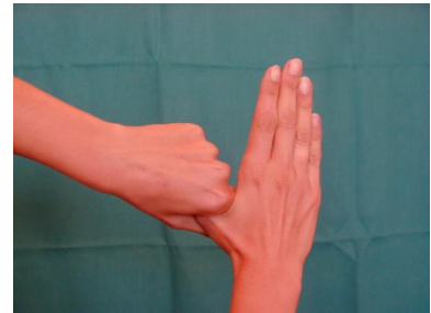
5. Daumen mit gegenüberliegender Hand vollständig umschließen und rotierend reiben