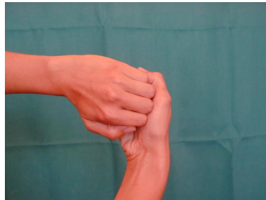
4. Hände ineinander verhaken und Finger gegeneinander bewegen