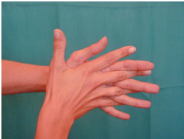
3. Mit ineinander verschränkten Fingern Handinnenflächen gegeneinander reiben